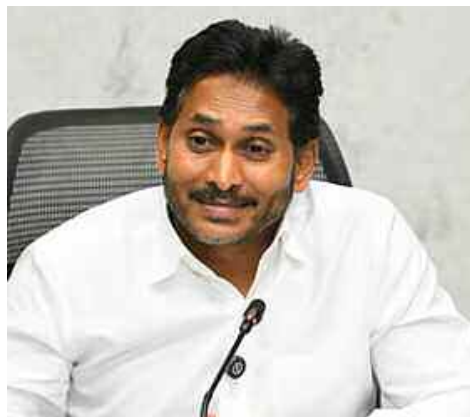
(తాడేపల్లి - జయజయహే)

రాష్ట్ర ఆర్థిక ఆరోగ్యంపై మాజీ ముఖ్యమంత్రి వైఎస్ జగన్ మోహన్ రెడ్డి తీవ్ర ఆందోళన వ్యక్తం చేశారు. కంప్యూటర్ అండ్ అడిటివ్ జనరల్ ప్రచురించిన 2025-26 ఆర్థిక సంవత్సర తాత్కాలిక ఖాతాలను విశ్లేషిస్తూ, కూటమి ప్రభుత్వ వైఫల్యాలను ఆయన ఎండగట్టారు. ముఖ్యమంత్రి చంద్రబాబు నాయుడు చెబుతున్న అభివృద్ధి లెక్కలకు, క్షేత్రస్థాయిలో ఉన్న వాస్తవ పరిస్థితులకు పొంతన లేదని.. రాష్ట్రం తీవ్రమైన ఆర్థిక ..మిగతా 2లో