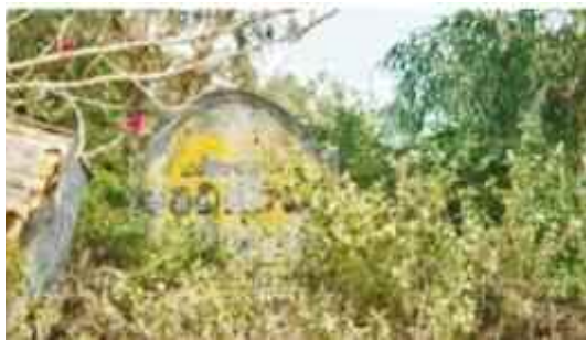
సాగునీరు, త్రాగునీటి అవసరాలు తీరుస్తుంది. ఈ అతిథి గృహం నుంచే ఎడమ కాలువ కార్యచరణలో అధికారిక

శ్రీకాకుళం జిల్లాలో టెక్నాలజీ వంశధార వ్యవస్థ ఎడమ కాలువ నిర్మాణములో ఉన్నతాధికారులు, ముఖ్య కార్యచరణ నివాసంగా ప్రాధాన్యత వహించిన టెక్నాలజీ వంశధార కార్యాలయ లో నిర్మితమైన అతిథి గృహం నేడు ఆదరణ కరువు గు బురు పొడలో అసాంఘిక కార్యక్రమాల అడ్డంగా మారి శిథిలానికి చెరువులో ఉండటం స్థానికులు ఆవేదన వ్యక్తం చేస్తున్నారు. ఒడిస్సా రాష్ట్రంలో పుట్టిన వంశధార కాలువ జలాలు గోట్టా బ్యారేజీ ద్వారా శ్రీకాకుళం జిల్లాలోని టెక్నాలజీ నందిగం, కోటబొమ్మాలి, సంతబొమ్మాలి, వజ్రపు కొత్తూరు, పలనూ, మారుమూల గ్రామ ప్రాంతాలకు