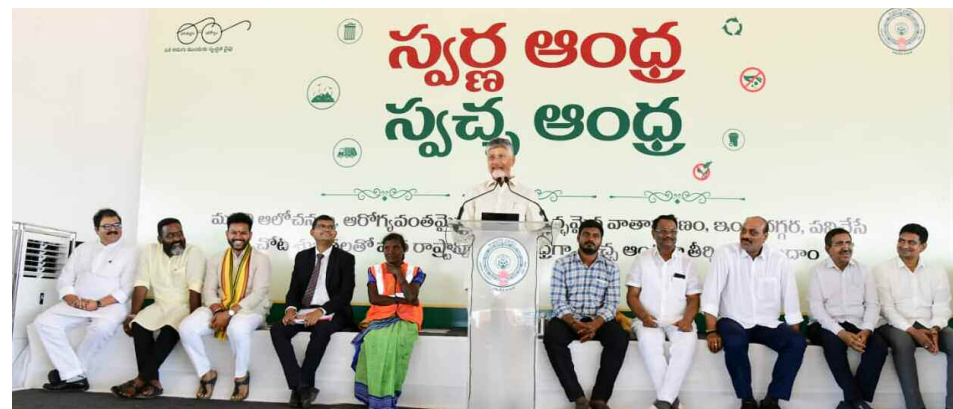
(శ్రీకాకుళం - జయజయహే)

మూడో బడ్జెట్ పుడితే రూ. 30వేలు ఇస్తాం నాలుగో బడ్జెట్ కు జన్మనిస్తే రూ. 40 వేలు ఇస్తాం వృద్ధ ఆంధ్రప్రదేశ్ కాకుండా నివారిస్తాం యువశక్తిని నిర్మిస్తాం... భవిష్యత్తును ఇస్తాం నరసన్నపేట సభలో సీఎం చంద్రబాబు ప్రకటన